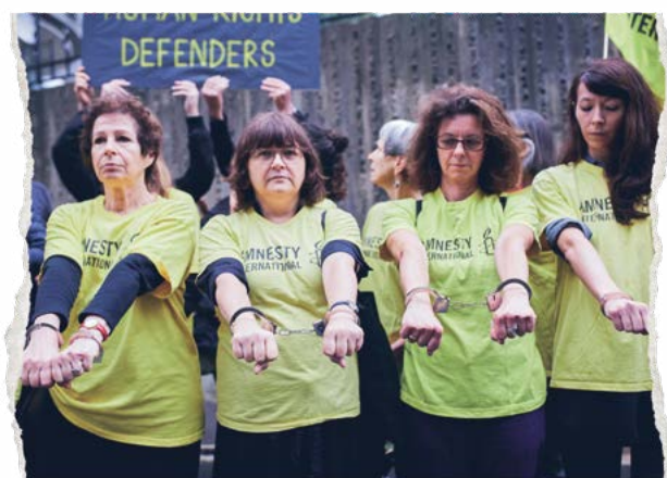
Protesta de la membresía de Amnistía Internacional frente a la embajada turca en París, julio de 2017.

Nuestro trabajo protege y empodera a las personas por medios que abarcan desde la abolición de la pena de muerte hasta la promoción de los derechos sexuales y reproductivos, la lucha contra la discriminación o la defensa de los derechos de las personas refugiadas y migrantes. Contribuimos a llevar a los torturadores ante la justicia. A cambiar leyes opresivas... y a liberar a personas que han sido encarceladas sólo por expresar su opinión. Alzamos la voz en nombre de todas y cada una de las personas que ven amenazadas su libertad y dignidad.