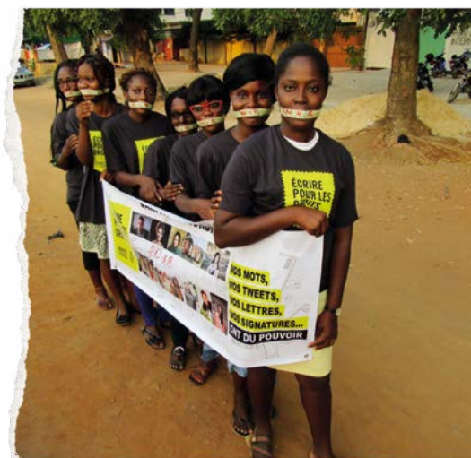
Activistas de la campaña Escribe por los Derechos, Togo.

Los derechos humanos no son artículos de lujo de los que se pueda disfrutar sólo cuando las circunstancias prácticas lo permitan.