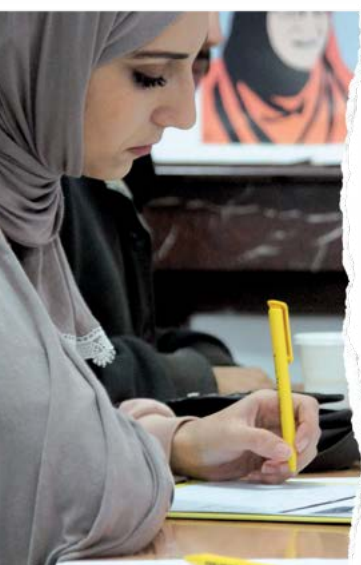
Evento de envío de cartas para la campaña Escribe por los Derechos, Argelia.