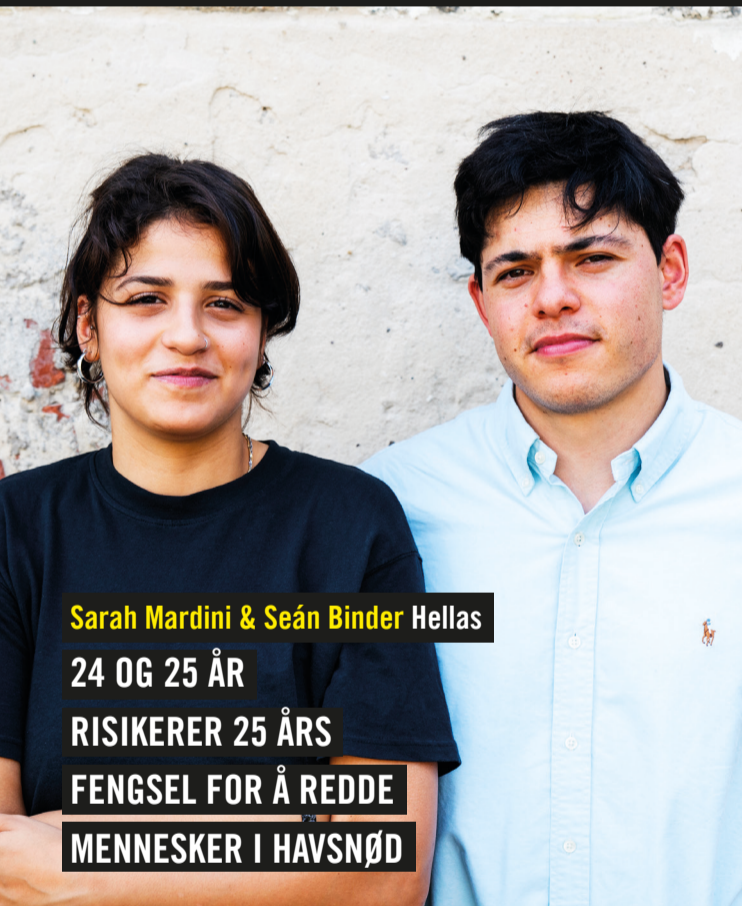
Sarah Mardini & Seán Binder Hellas