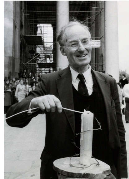
Peter Benenson Amnestys grunnlegger, ved Amnestys 20-årsjubileum i London, 1981.